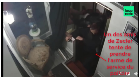
Capture d'écran de la vidéo de Bruno Attal.

C'est l'autre accusation mensongère livrée par Bruno Attal. L'un des jeunes aurait tenté de voler l'arme de service d'un des policiers lorsqu'il voulait ouvrir la porte menant au sas.