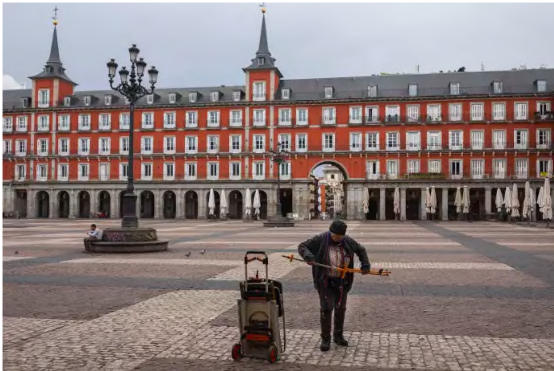
Un caricaturiste range son matériel faute de clients, sur la Plaza Mayor à Madrid, le 15 mars.

L' Espagne , deuxième pays le plus touché d'Europe, a pris des mesures particulièrement radicales : quarantaine quasi totale et état d'alerte pour quinze jours. Séville et d'autres villes ont annoncé l'annulation des célèbres processions de la Semaine sainte début avril.