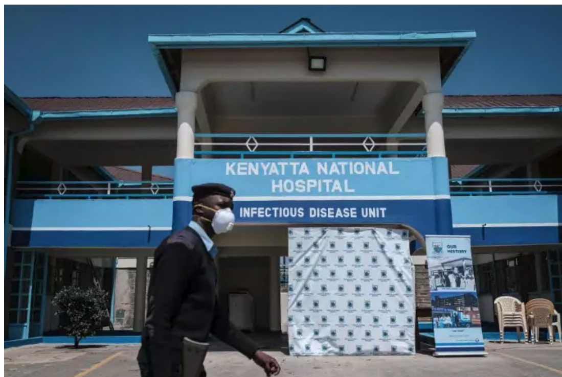
A Nairobi, au Kenya, le 13 mars.

L' Algérie a annoncé la suspension de ses liaisons aériennes et maritimes avec la France. Le Kenya , où trois cas de coronavirus ont été officiellement décelés, a annoncé dimanche la fermeture de ses frontières, sauf pour ses citoyens et les résidents étrangers, qui devront se soumettre à un autoconfinement. L' Afrique du Sud a choisi de fermer ses frontières aux citoyens des pays à risque : « l'Italie, l'Iran, la Corée du Sud, l'Espagne, l'Allemagne, les Etats-Unis, le Royaume-Uni et la Chine à partir du 18 mars. »