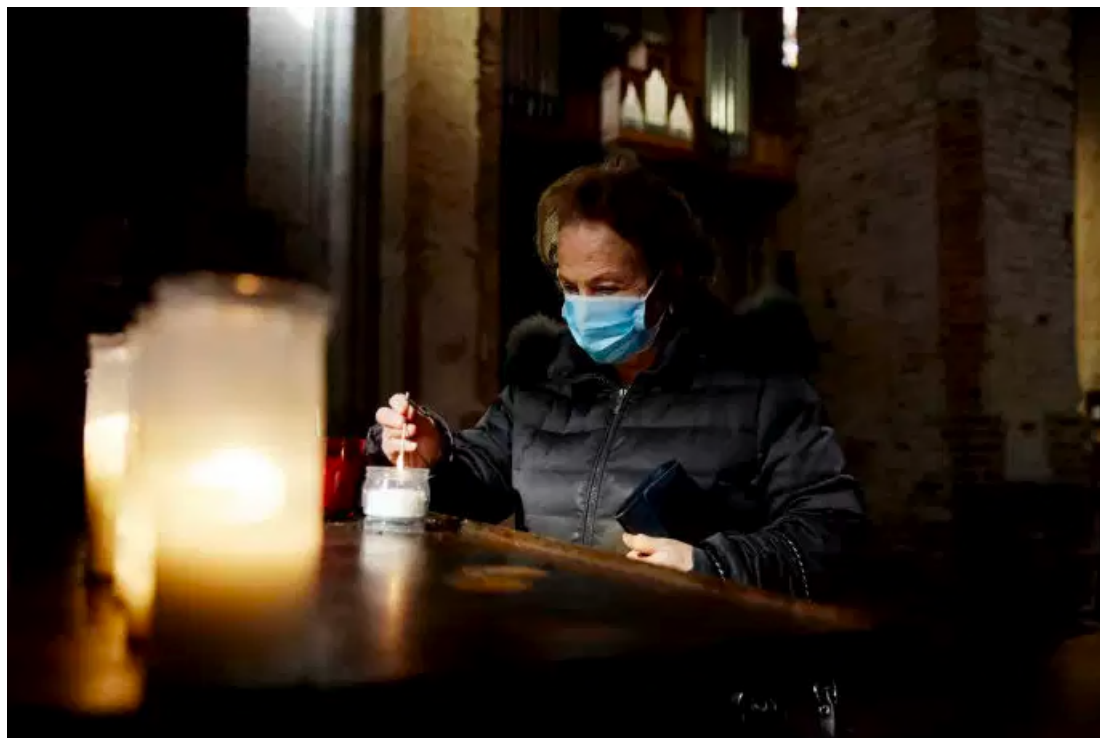
Dans l'église San Simpliciano à Milan en Italie, le 15 mars.

Pays le plus touché par l'épidémie en Europe, l'Italie enregistre désormais 1 809 décès, soit 368 morts de plus en vingt-quatre heures, un nombre inédit jusqu'alors, ont annoncé dimanche les autorités. Le nombre total de cas confirmés s'élève dans le pays à 24 747, contre 21 157 samedi.